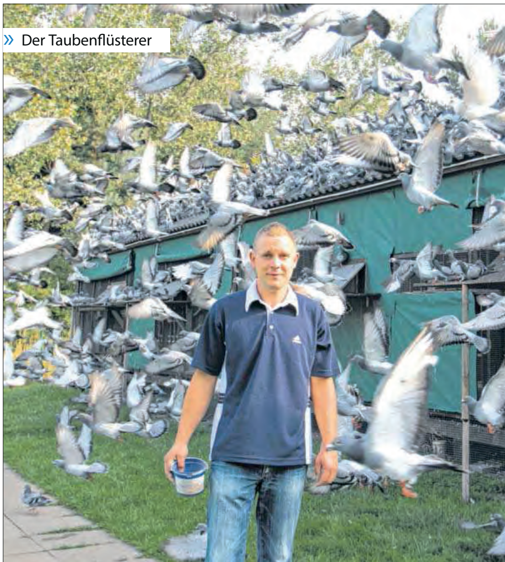
» Der Taubenflüsterer